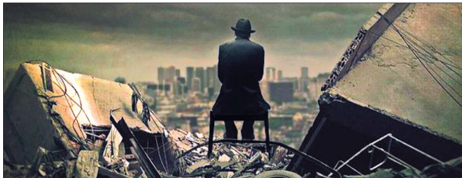
Εικόνα 1: Βαδίζουμε ολοταχώς προς την «έκτη μαζική εξαφάνιση» του γήινου βιόκοσμου: μία πλανητική κλίμακας καταστροφή που τα αίτιά της, αυτή τη φορά, θα είναι ανθρωπογενή. ( https://el.wikipedia.org/wiki/Ανθρωπόκοινος ).

«Τεχνητή Νοημοσύνη (AI) ορίζεται η ικανότητα των μηχανών να εκτελούν εργασίες που συνήθως συνδέονται με νοήμονα όντα» (1). Σύμφωνα με την Encyclopedia Britannica, η τεχνητή νοημοσύνη είναι «η ικανότητα ενός ψηφιακού υπολογιστή ή ενός ρομπότ ελεγχόμενου από υπολογιστή να εκτελεί εργασίες που συνήθως συνδέονται με ευφυή όντα». Ο όρος χρησιμοποιείται συχνά στο έργο της ανάπτυξης συστημάτων «προικισμένων» με τις διανοητικές διαδικασίες που είναι χαρακτηριστικές των ανθρώπων, όπως η ικανότητα να συλλογίζονται, να ανακαλύπτουν νοήματα, να γενικεύουν ή να μαθαίνουν από την εμπειρία του παρελθόντος. Αυτοί οι ορισμοί μας βοηθούν να συνειδητοποιήσουμε, α-