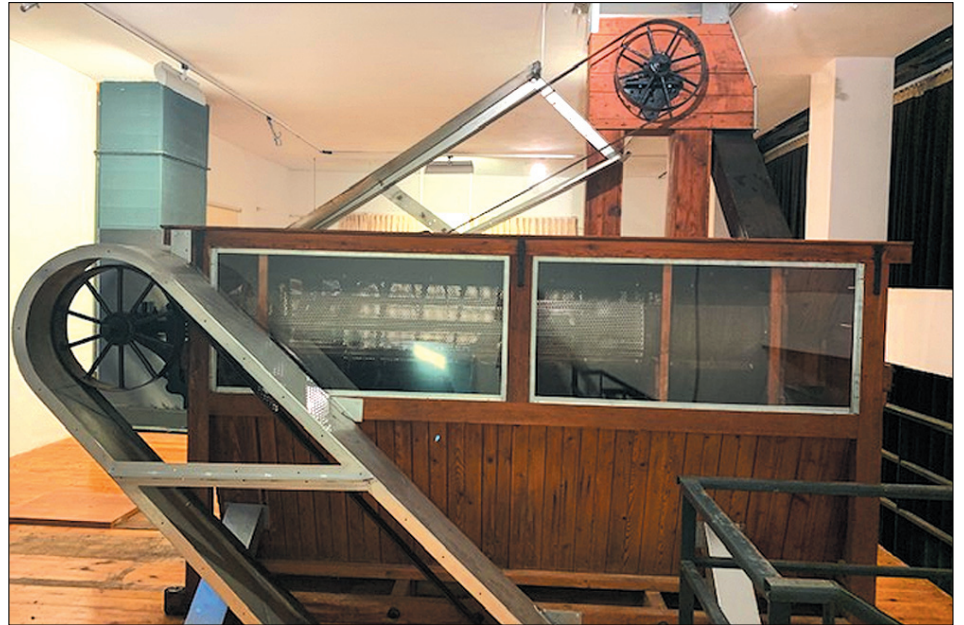
Εικόνα 3. Ο μηχανολογικός εξοπλισμός του χαρουπόμυλου μετά τις επισκευές.

Θα πρέπει να αναφερθεί ότι το κόμμι του χαρουπιού έχει αξιολογηθεί ως πρόσθετο τροφίμων. Στις 20-1-2017 μετά από αίτημα της Ευ-