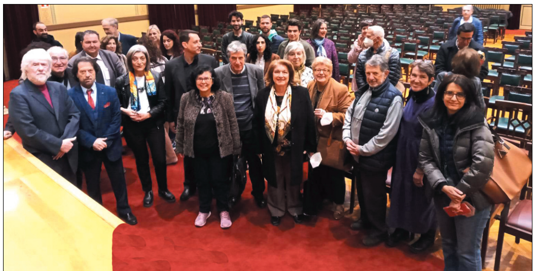
Στη μεγάλη αίθουσα των εκδηλώσεων