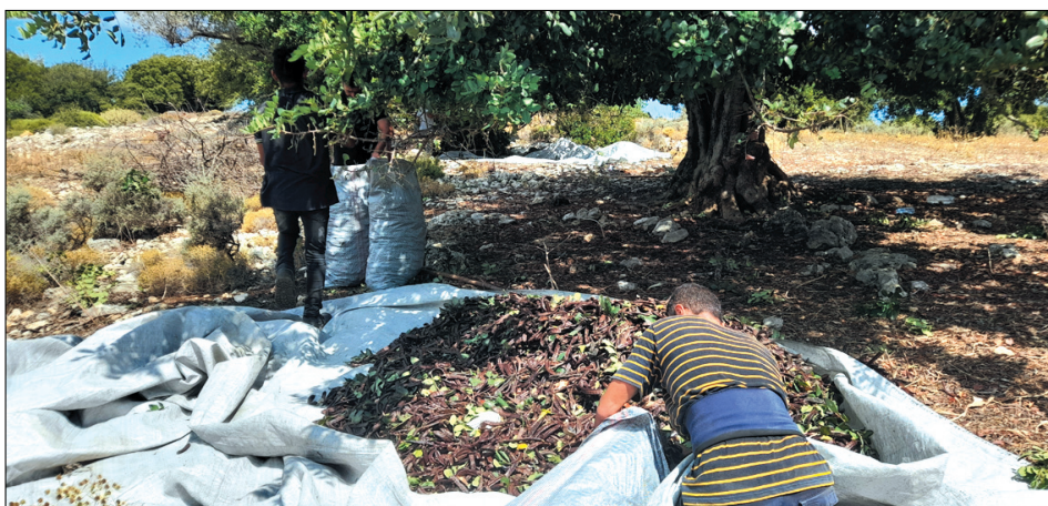
Εικόνα 2. Η συγκομιδή της χαρουπιιάς

2. Η EFSA (European Food Safety Authority), είναι ο Ευρωπαϊκός Οργανισμός που χρηματοδοτείται από την Ευρωπαϊκή Ένωση και λειτουργεί ανεξάρτητα από τους Ευρωπαϊκούς θεσμούς (Ευρωπαϊκή Επιτροπή, Ευρωπαϊκό Συμβούλιο, Ευρωπαϊκό Κοινοβούλιο) αλλά έχει ανεξαρτησία από τα μέλη της Ευρωπαϊκής Ένωσης. Θεσμοθετήθηκε το 2002 και αποτελεί το Ευρωπαϊκό Οργανισμό της ασφάλειας των τροφίμων. Ο Οργανισμός λειτουργεί κάτω από το ρυθμιστικό πλαίσιο 178/2002. Βασικός του σκοπός είναι η επιστημονική τεκμηρίωση της ασφάλειας των τροφίμων και λειτουργεί ως σύμβουλος σε θέματα τροφίμων στα οποία η Ευρωπαϊκή Επιτροπή, το Ευρωπαϊκό Κοινοβούλιο και τα κράτη μέλη θέτουν ερωτήματα ασφάλειας των τροφίμων. Η EFSA διοικείται από ένα διοικητικό συμβούλιο του οποίου τα μέλη έχουν εντολή να ενεργούν προς το δημόσιο συμφέρον.