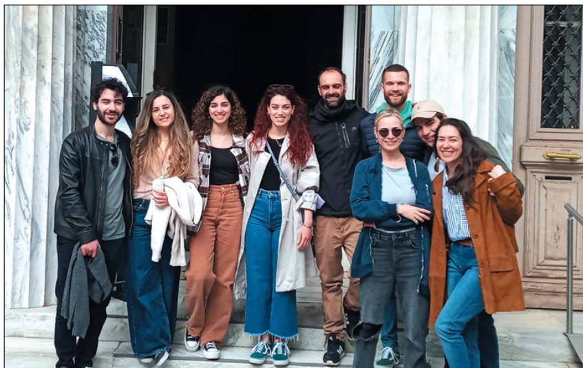
Οι νέοι του Συλλόγου μας στην είσοδο του Μεγάλου

ποιήθηκαν για την ανέγερση της νέας εκκλησίας. Ο ναός του Αγίου Γεωργίου πήρε το προσωπικό Καρύκη προς τιμήν των κλητόρων του. Τα μεταεπαναστατικά χρόνια η αθηναϊκή ντοπιολαλιά χαρακτηριζόταν για τοιτακισμό. Μετέτρεπε δηλαδή στον λόγο το Κ σε ΤΣ. Έτσι το προσωπικό Καρύκης με την παραφθορά έγινε Καρύτσης, κάτι που επικράτησε μέχρι σήμερα.