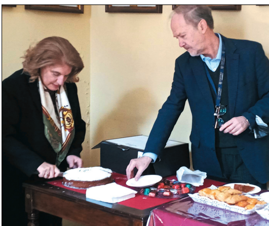
Η Πρόεδρος και ο Αντιπρόεδρος του Συλλόγου μας