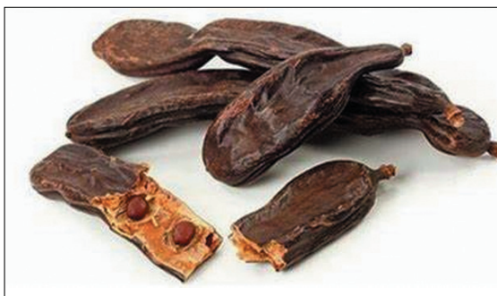
Εικόνα 1. Καρποί, σπόροι και δένδρο χαρουπιάς ( Ceratonia siliqua ).

Οι Άραβες, στους οποίους πιθανότατα οφείλεται η προ-